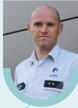
Pascal Quintens Wijk 12 - Beverlo