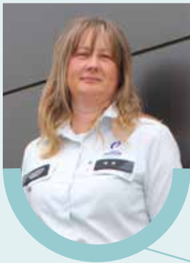
Genia Vangenechten Wijk 3 - Tessenderlo centrum noord

Wil jij precies weten onder welke wijkagent jouw straat valt? Raadpleeg dan onze website www.politie-bht.be .