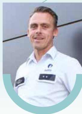
Peter Penne Wijk 8 - Paal noord