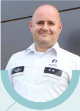
Gunter Nys Wijk 6 - Kwaadmechelen