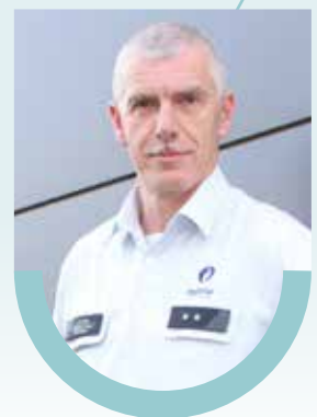
Jos Witters Wijk 9 - Paal zuid