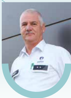
Axel Marting Wijk 16 - Beringen centrum